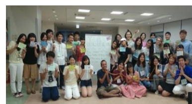
学生交流活動(タイカルチャーデー2016)