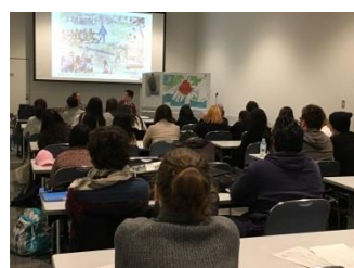
平和学習 (ヒロシマ被爆体験者による講義の様子)