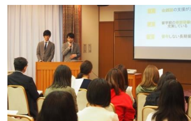
合同留学体験報告会