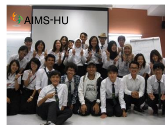
AIMS-HU学生セミナー (タイ・カセサート大学内にて)