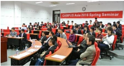
〈スプリングセミナー 上海交通大学 2016/4/26-4/28〉