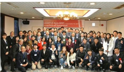
〈キックオフシンポジウム 九州大学 2017/2/22〉