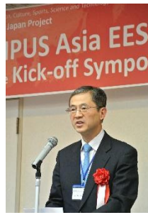
〈キックオフシンポジウム MEXT田浦分析官によるご挨拶〉