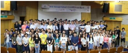
〈サマースクール 釜山大学校 2016/8/16~8/26〉