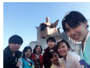
〈中韓ワークショップ: 成均館大学生と学生交流〉