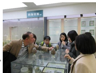
〈自然系プログラム: 吉林大学植物科学学院視察の様子〉