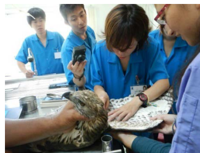
野生動物実習(カセサート大学)