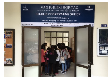
〈ハノイ国家大学外国語大学内 ハノイ事務所〉

日本経済界が次のビジネス展開の場として注視するアフリカにおいて、大学としてのプレゼンスを確立する。2020年までに拠点設立を掲げているガーナを中心に修士生及び現地日系企業の協力を得て、産学協働によるアフリカでの人材育成に貢献する。