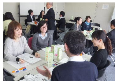
〈スタッフ・デベロップメント研修の様子〉

経済界からの強い支援を受けた建学の背景から本学は有職者が多数を占めている。このことに伴い、社会人特別選抜入試制度を設け、多面的な入学者選抜を実施している。また、国外入試の面接では、Skype及び現地での対面面接を実施した。