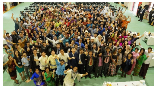
〈43ヶ国・地域から集まる留学生〉

2015年度に開設した国際大学ハanoi国家大学外国語大学ハanoi共同事務所を活用し、IUJ-ULIS Hanoi Office 1st Symposiumを主催した。本学の日本人修了生で在ベトナム日本企業(本学グローバル人材パートナーシップ企業)責任者、ハanoi工科大学教員(国際大学修了生)ならびにジェトロハanoi事務所調査員の3名をゲストスピーカーに迎え、ベトナムの産業や経済について講演を行った。本シンポジウムには、在ベトナム日本公館・機関及び日本企業関係者ならびに本学修了生など約60名が参加し、現地に展開する日本企業等との産学連携を推進した。