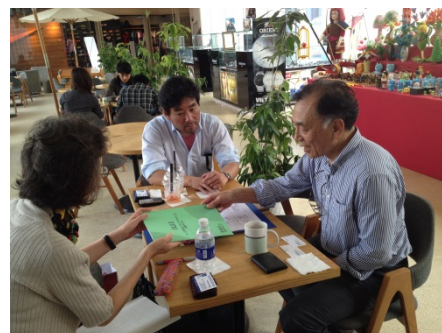
〈ベトナムにてヒアリング調査を実施〉

現在、本学では大学の計画立案、政策形成、意思決定においては、修士生サーベイや学生による授業評価アンケートを用い、データやエビデンスに基づいた業務改善を行っている。平成26年度から着手した教務システムの改修により、IRの概念を教職員が共有し、各部署等でのデータ分析を可能とし、内部質保証(PCDAサイクル)を推進する。