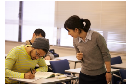
〈日本語クラスの様子〉

「国際協力人材育成プログラム」を「国際協力人材育成プロフェッショナル・スクール」に発展させ、更に高度な学問的教育環境を提供し、アジアを題材とした「地の拠点」を確立する。学士・修士・博士の一貫教育にて、国際公務を担う人材を輩出し、グローバル・イシューの解決を促す。