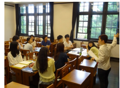
〈国際協力人材育成プログラム 講義の様子〉