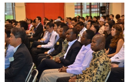
〈平成26年度入学式の様子〉

本学では、スーパーグローバル大学創成支援を通じて、グローバル化の垂直展開、水平展開を図り、社会への貢献を果たしていく。