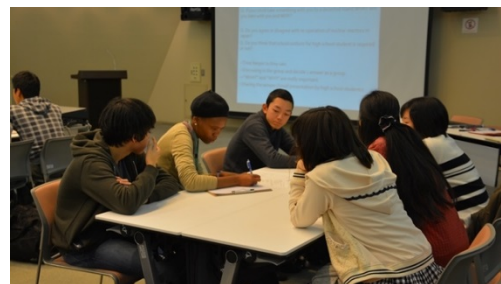
〈異文化コミュニケーション研修の結果〉

同じく南魚沼市に位置する県立国際情報高校を中心にSGH指定校との連携に努めている。国際情報高等学校は「【雪国*米どころ*魚沼】の世界発信を促した人材育成 ~浦佐から世界へ~」を研究テーマに、地元魚沼の魅力を世界に発信しながら、地域が抱える課題、さらには関連する世界の地域課題について、グローバルな視点から考察・提案できる人材育成を目指している。取り組みの一つである地域研究の授業に本学教員及び学生が講師として参加し、プレゼンテーションの指導を実施した。また、各種行事では、本学留学生との交流の機会を提供している。加えて、今年度は横浜市立南高等学校の1年生25名を迎え、異文化コミュニケーション研修を実施した。研修は、英語を「アウトプット」することに重点を置き全編英語で実施され、本学学生もファシリテーターとして研修に参加した。本学は、積極的にSGH選定校との連携を図り、後期中等教育を支援することで、教育のグローバル化を牽引していく。