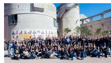
〈MBA World Summit 2018〉