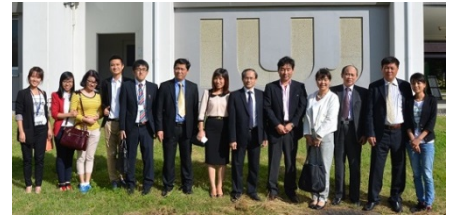
〈ベトナム ハイフオン市使節団来校〉

また、平成24年から明治大学・立教大学と共同でスタートした「国際協力人材育成プログラム」では、ミャンマー人専任教員によるミャンマーへのフィールド・トリップを含んだ科目「アクティブ・リサーチ」を提供しており、海外への日本人学生の送り出しプログラムを展開している。