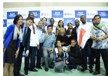
〈47ヶ国・地域から集まる留学生〉

外国語のみで学位を取得できるコースの数は、国際関係学研究科に博士後期課程を設置に伴い、採択時10コースから2014年に立ち上げた公共政策プログラムと併せ、16コースに増加し、引き続きすべての授業を英語で実施している。国際経営学研究科では、欧米のビジネススクールの収容定員に習い、収容定員を150名から180名に増員した。