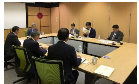
〈 第1回国際大学スーパーグローバル創成支援事業 大学外部評価委員会 〉

平成30年度からの国際大学中期計画(新5ヶ年計画)が理事会において承認され、本学が目指す将来像として「新ビジョン」が示された。この新ビジョンでは、世界と日本をつなぎ、そして国際社会の多様性を促進して国際的な活躍のできる将来のグローバル・リーダーにバランスのとれた学修経験を提供することを掲げ、3つの基軸を設けた。①教育研究両面において日本に関するメッセージを世界へ積極的に発信する ②行政・ビジネス分野において高度なプロフェッショナルを育成する ③教育プログラムの基礎分野における学際性を高める