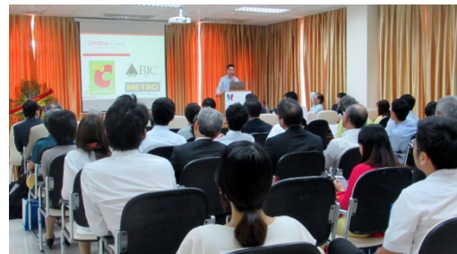
〈シンポジウムの様子〉