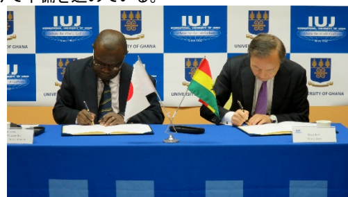
〈大学間協定締結の様子〉

「日本・アフリカ大学連携ネットワーク(JAAN)」及び留学コーディネーター配置事業の活動、現地への訪問を通して、アフリカ諸国での基盤づくりに取り組んだ。在外公館、日本企業とのネットワーク強化と同時に、現地教育機関との交流、修了生ネットワークの強化を推進することで、日本企業と現地の人材を結ぶ架け橋となる。2017年3月2日にガーナ大学とアフリカ地域に所在する高等教育機関との間では初となる大学間協定を締結した。本学は日本経済界が注目するアフリカを重点地域とし、先見性をもって人材育成に挑戦する。