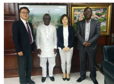
〈左から〉国際大学信田教授、ガーナ大学Vice Chancellor、国際大学職員、ガーナ大学Dean of Agriculture(IUJ修了生)

日本貿易振興機構、長岡技術科学大学ならびに国際大学は、ベトナム(ハノイ)において「ハノイ・新潟情報交換会」を開催した。本会は、平成28年5月に三機関の異なる強みを活かした新潟企業の海外展開支援、新潟への外国企業誘致、国際人材育成等を目的として締結した包括連携協定に基づき企画・開催したものである。海外展開を検討している日系企業、ベトナムに進出している日系企業ならびにNUT, IUJ, HUSTの同窓生等、総勢180名が参加した。平成29年は日越外交関係樹立45周年にあたる年であることから、その記念行事の一環としても位置づけられた。