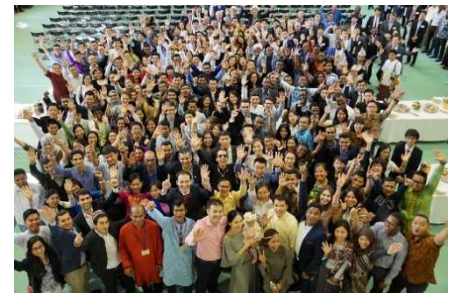
〈 新入生歓迎の日 〉

平成30年2月にビジネススクールの国際認証機関であるAACSBの認証を取得した。また、認証取得のための取り組みにより、教育課程の体系的編成及び教授方法の工夫・開発を行うことで、教育プログラムの一層の向上を図り、国際経営学研究科の学生に対して恒常的に世界水準の教育を提供していく。