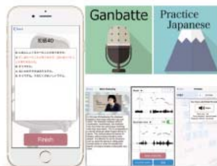
〈日本語教育アプリケーション〉

e-learning教材の作成ならびに海外拠点におけるビジネス日本語教育の提供によって、日本語教育の更なる拡充を図った。2015年度に作成した日本語学習アプリケーション「がんばってかな」に加えて、今年度は日本語学習アプリケーション「がんばってシャドーイング」を作成した。日本語学習アプリケーション2種は、日本語クラスへの導入を開始、e-learningと対面型授業を組み合わせたブレンディッド教育を提供することにより、個々の学習者への細かいケアと自学に適した仕組みを構築することができた。無料で配信しているため、本学学生のみならず、世界各地で活用されている。