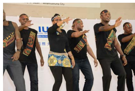
〈国際ナショナル・フェスティバル/アフリカチーム〉

また、海外拠点におけるビジネス日本語教育提供のため、日本語担当教員がベトナムやミャンマーを訪れ、現地のニーズに合わせた教育教材を制作すると共に、現地政府関係者や教育関係者、企業人とのネットワークを構築した。