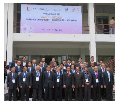
〈ハノイ・新潟情報交換会〉