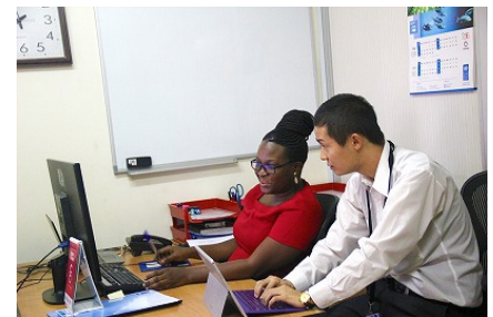
国連ユースボランティアでウガンダに派遣された学生の様子

〈平成35年の最終目標値3.1%⇒現状1.4%〉 基準スコアを達成する学生が、25年度155名から28年度418名へと着実に増加した。また、課外の語学講座についても質と量の両面で拡充し、年間18講座・レベルに応じた計48コースを開講し、受講者数は1,858名(昨年の受講者は1,702名)、前年度比109.2%となった。