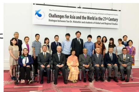
国際学部開学記念イベント「マハティール・ビン・モハマド閣下と学生の対話集会」の様子

本学のグローバル化を牽引するため、当初計画を2年前倒し、平成29年4月に国際学部グローバル・イノベーション学科(新設)及び国際地域学科(改組)を白山キャンパス内に開設した。また、国際観光学部(改組)及び情報連携学部(新設)も同時に開設した。国際学部グローバル・イノベーション学科では全ての授業を英語で実施し、日本人学生は1年間の海外留学が必須となっている。入学定員30%は外国人留学生であり、本学のグローバル化推進を加速化する役割を担っている。