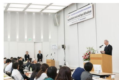
UMAP25周年記念シンポジウム 開会式の様子

UMAP (University Mobility in Asia and the Pacific)の国際事務局として、2回の国際理事会をマレーシアおよび日本で開催。また、平成28年9月23日には東洋大学白山キャンパスにおいてUMAP設立25周年記念シンポジウムを実施し、国内外の教育関係者約200名が参加した。また、平成28年度には新たに14大学がUMAPを通じた学生交換を行うための参加公約書を締結。今後も加盟校の拡大を図り、アジア太平洋地域の国際教育交流の活性化を目指していく。