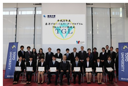
東洋グローバルリーダープログラム TGLシルバー認定式

「TOYO-UCLA継続教育センター」が提供するビジネス英語講座「BECプログラム」をはじめ、学内で実施している英会話講座「Toyo Achieve English」を学外にも開放し、ジュニア英会話講座や社会人向け英会話講座を開講。本学学生のみならず全世代へのグローバル教育を実施している。平成28年度はBECプログラムが企業研修を含め65名、Toyo Achieve English講座はジュニア講座、一般英会話講座の他、英語ガイド講座を開講し168名が受講した。