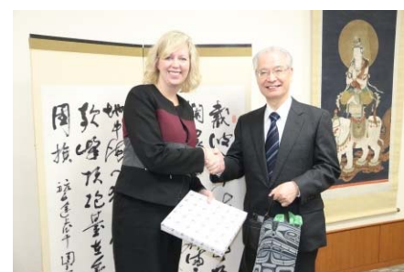
カナダ・ダグラスカレッジとの 協定調印式の様子

グローバル化に対応した教育を進めるため、海外の高等教育機関と積極的に協定を締結。新規開拓にあたっては、質の高い教育プログラムを提供する大学、また、ブリッジプログラムとして受入可能な大学を中心に協定の締結を行った。平成29年度には47大学との新規締結を行い(昨年度29大学)、昨年度に引き続き協定締結の大幅な増加となった。その結果、学生交流協定は65大学から87大学へ増加し、海外留学における本学学生の選択肢が広がった。