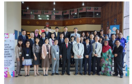
〈 UMAP国際事務局を招致 〉

UMAP国際事務局を平成28年1月より5年間本学が務めることになり、アジア太平洋地域における高等教育レベルでの交流促進に一定の貢献をすることが可能となった。さらに参加国/地域や参加大学を広げ、アジア太平洋地域における学生交流を活性化していく必要があると認識しており、これまで日本からUMAPを通じて他国に留学する学生がほとんどいなかったため、日本からの留学を促進することも視野に入れ交流スキームを見直す準備に入っている。