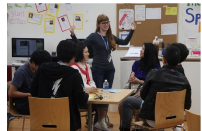
〈 English Community Zone 〉

「日本を飛び出し、Diversityに触れる・Diversityを活かす」をテーマとし、フィールドワークを通じてアクションプランを考える課題解決型の海外研修「Diversity Voyage」を実施している。比較的海外経験の少ない学生も多く参加(平成27年度は全学部から計117名の学生をタイ・フィリピン・マレーシア・ラオスに派遣)し、参加後も多くの学生が国内外を問わず国際的な活動に積極的に従事している。