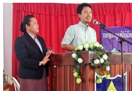
〈トビタテ！留学JAPAN第1期生が「優秀賞」「アンバサダー賞」を受賞〉

＜平成35年の最終目標値10.3%⇒現状4.3%＞ 単位認定の対象外であった海外プログラムが多数あったため、全学共通の単位認定科目群を創設したことにより、学生の海外志向上昇に繋がっている、また、国連ユースボランティア(3年続けて1名選抜)、ワシントンセンターにおけるインターンシップ(3年続けて1名が選抜)など高い競争選抜を伴う留学プログラムやインターンシップに継続して学生を派遣しており、「官民協働海外留学支援制度トビタテ！留学JAPAN」への参加学生数も増えている。