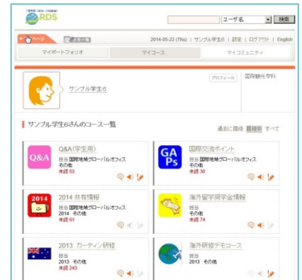
〈Eポートフォリオによる成果の可視化〉

TOYO-UCLA継続教育センター等において、全世代を対象とする共同講座を展開し、平成35年に講座開講数を500、受講者数10,000人を目指す。