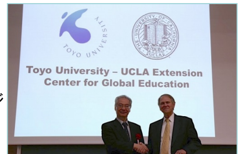
〈UCLAエクステンションとの提携〉

新学部設置や高大連携等、本学が推進する総合学園計画と連動した「全世代グローバル教育」を推進する。平成27年2月13日にUCLAエクステンションと東洋大学の間で正式協定を結び、「TOYO-UCLA継続教育センター(Toyo University - UCLA Extension Center for Global Education)」を正式に発足させた。本センターでは、BEC(Business English Communication)プログラムを提供する。また、本学学生が正規科目として受講できるコースとして、平成27年度から学部生向けの「ビジネス英語」を設置した。この授業は、UCLAエクステンションのBECと同じカリキュラムで行われ、学生が引き続きセンターでの課外クラスを受講することにより、UCLAエクステンションから認定を受けることができる。また、今後も幼稚園や小・中・高の生徒、シニアを対象にした英語プログラム、留学支援プログラム、夏期海外研修等を企画・運営し、全世代グローバル教育を実践する。