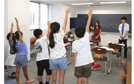
〈 Toyo Achieve English ジュニア講座 〉

「TOYO-UCLA継続教育センター」が提供するビジネス英語講座をはじめ、学内で実施している英会話講座「Toyo Achieve English」を学外にも開放し、ジュニア英会話講座や社会人向け英会話講座を提供し、本学学生のみならず全世代へのグローバル教育を実施している。