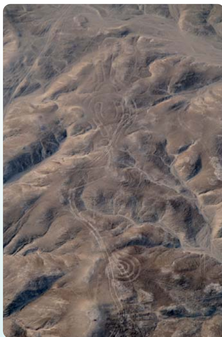
図1 新たに発見した地上絵(2006年)

平成21～25年 新学術領域研究（研究領域提案型） 「アンデス文明の盛衰と環境に関する学際的研究」