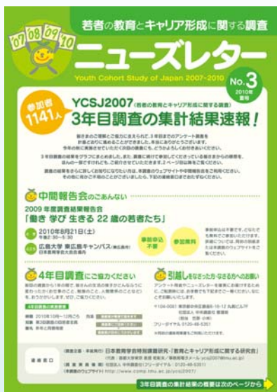
図1 毎回の調査ごとに発行しているニュースレター。回答者に送付し、あわせて住所変更の有無などを問い合わせている。