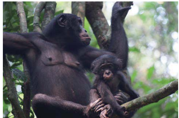
図2 野生ボノボの親子（コンゴ盆地にて）

チンパンジーとボノボは、サピエンス人とネアンデルタール人の関係に等しい。男性優位で攻撃的で隣り合う群れが殺し合い多様な道具を使うチンパンジーと、女性優位で平和共存的でほとんど道具を使わないボノボ。両者の共通部分こそが、人間の本性を考えるアウトグループになる。外国を見ることで日本がわかる。同じ論理で、人間のすぐ外側にいるチンパンジーとボノボの研究によって、はじめて人間の本質が見えてくると考えた。他に類例をみない「実験研究と野外研究を融合させた新たなアプローチ」によってチンパンジーとボノボの認知機能の生涯発達の全体像の把握が著しく進むだろう。