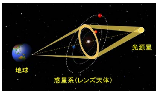
図1：重力マイクロレンズの模式図。光源星の光がレンズ天体の重力で曲げられ増光して見える。惑星の重力により、さらに短く増加する。

背景天体の前を他の星（レンズ天体）が通過すると、その重力がレンズの様な働きをして背景天体か