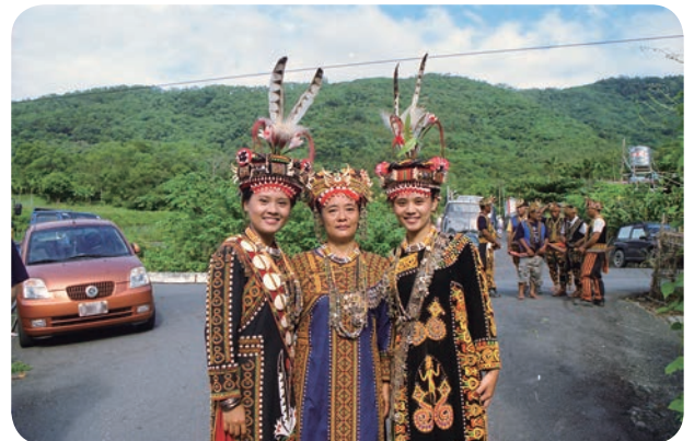
図2 原住民族性を可視化する際に有効な手段となる、民族衣装を着たパイワン族の親子

2014-2017年度 基盤研究 (B) 「台湾原住民族の分類とアイデンティティの可変性に関する人類学的研究」