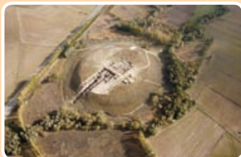
▲図1 カマン・カレホユック遺跡2010