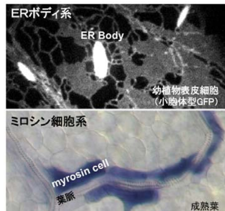
図2. 虫害防御応答能力を支える2つの忌避物質生産系

「植物の器官が真直ぐに伸びる」という概念は古くからあるがその実体は未知である。本研究は、240年前に発見されて以来の謎である植物細胞の原形質流動の生理学的意義に迫るとい意味から学術的な意義は大きい。ER ボディ忌避物質生産系の研究は、小胞体由来の植物の防御システムとして新たな分野を切り拓くと期待している。