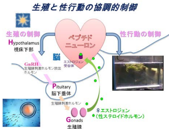
図1. ペプチドニューロンによる生殖と性行動の協調的制御