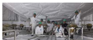
図3. 再建作業終了後の外水槽内部。

ク赤道部は岩盤に近く検出効率が他と比べかなり低いことがわかり、PMTの光電面を赤道部に向けること、さらに赤道部の光反射膜として新たな部材の測定を行い選定した。さらに高量子効率のPMTの導入を決定した。これらにより検出効率が1桁近く向上することが期待される。また地磁気とその補償コイルによる外水槽内の磁場について評価を行い、光電子増倍管のミュオン製メッシュとコーンの遮蔽効果を測定し引き続き利用することを決定した。外水槽改修作業は2016年1月から開始し3月上旬に無事完了した(図3)。なお水槽の水漏れ対策として補修工事を施した。現在注水を開始しており、新年度から新たなデータ採取の準備がほぼ整った。