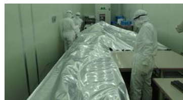
図2. 保護袋に入れ窒素ガス密封する直前の00ミニバルーン。

(外水槽再建) 初年度は検出器の仕様策定を行い、シミュレーションをもとに光電子増倍管の数と配列を決定した。球形タン