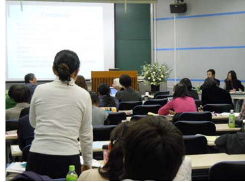
写真4 国際セミナー意見交換風景