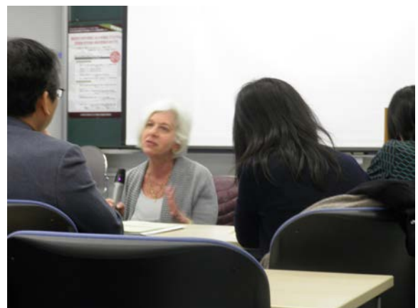
写真2 特別講義風景