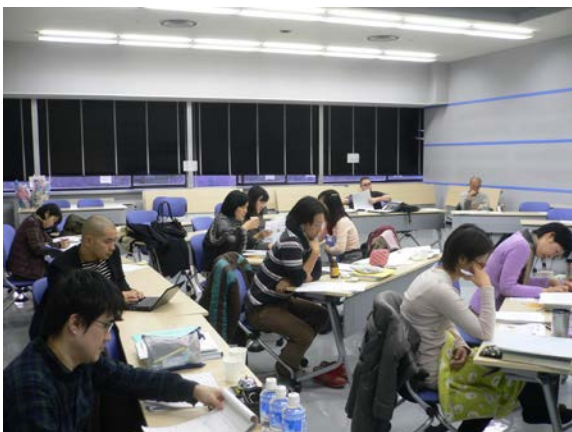
写真1 福祉プログラム評価科目受講風景

なお、福祉プログラム評価研究履修コースの修了者は、2010年度には前期課程1名、2011年度には前期課程5名、後期課程2名であった。