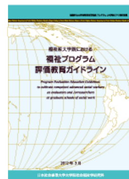
写真6 ガイドライン