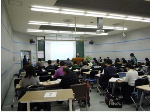
写真3 国際セミナー講演風景

セミナーでは、各国における福祉プログラム評価教育の現状と課題を共有するとともに、科学的根拠に基づく実践(EBP)に果たす、福祉プログラム評価教育の関与について検討した。また、福祉プログラム評価教育ガイドライン・指導マニュアルの枠組みについて議論を行い、聴衆者からも活発な意見がなされ、ガイドラインに求められているものなど必要性を再認識することができた。