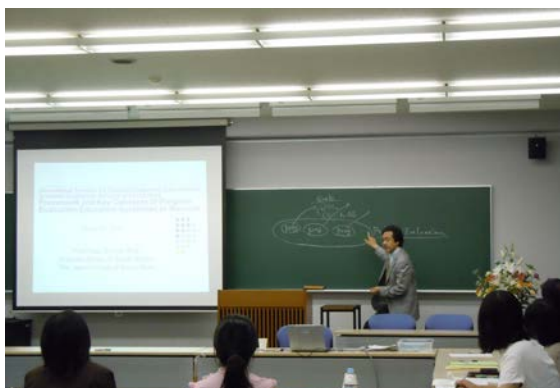
写真5 ガイドライン作成の為の会議風景

これらの結果、2012年3月には、福祉プログラム評価教育ガイドラインの日英両国語版(暫定版)を完成した。このガイドラインは、日本の福祉系大学院関係者に配布するとともに、大学のホームページ等にて公開し、広く普及を図っている。