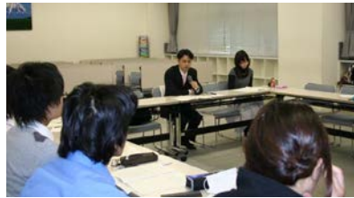
写真2 学外実習報告会においてコメントする施設側指導担当者