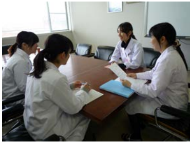
写真1 実習施設での指導の様子

得るとともに、地域の対人援助の課題について緊密な連携を進めていくことを確認し、実習継続の基盤を構築できた。今後は、より実践的な形態での実習などで、基本的な実践力と現場の多様な事態に臨機に依る対応力を向上させるものにしていくことが期待される。