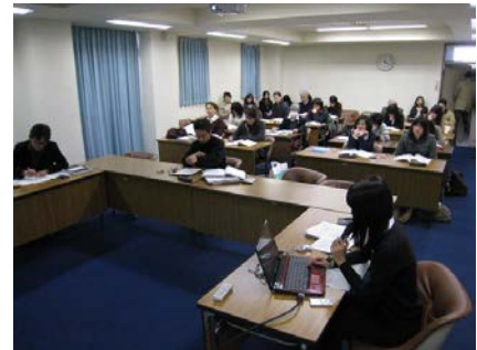
写真 5 修士論文公開審査会の様子

論文提出後の最終試験（口頭試問）は、プログラム前は、論文執筆者（学生）と審査者3名だけで非公開で行っていたが、審査をより適正かつ公正に行うために、広く学内外に公開して実施することにした。公開審査会の開催を専攻ホームページや学内の電子掲示板に掲載し、広く参加を呼びかけた。次年度以降に修士論文の執筆を予定している学生もほとんど参加するため、教育効果も大きい。