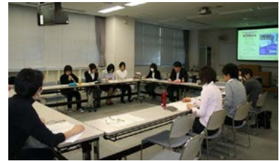
写真3 学外実習報告会