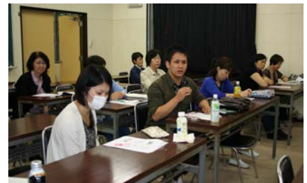
写真4 第2回公開授業報告会（平成21年9月30日）

ただし、学生が将来関わる現場は多様で、問題関心もかなり異なるにもかかわらず、調査法を修得するための授業を実習形式で展開するためには、ある程度斉一的な方法をとらざるを得ないため、個々の学生のニーズに必ずしも応えきれない点が課題であり、個別の指導のなかで補う必要がある。