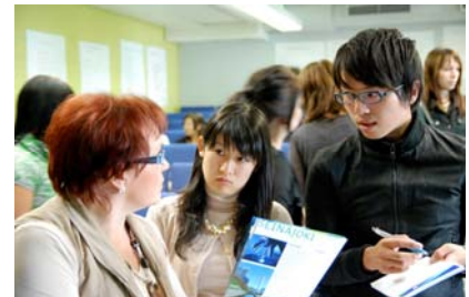
写真 4. セイナヨキ応用科学大学 (Finland) における学生の海外派遣研究活動