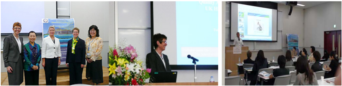
写真 2. 国際セミナー