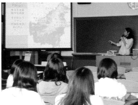
図5 大学院セミナーの様子。

以上、4つの支援プログラムはおおむね当初計画どおりに実施することができた。今まで本研究科では外部講師を招いたセミナーなどは個別に散発的に行われていただけであり、3分野で組織的に開催されるようになったことの意義は大きい。また、修士研究発表会などサイエンス・アウトリーチ活動によって、大学院における研究成果を市民に対して発表する機会をもつようになったことは、大学院生自身の個人的