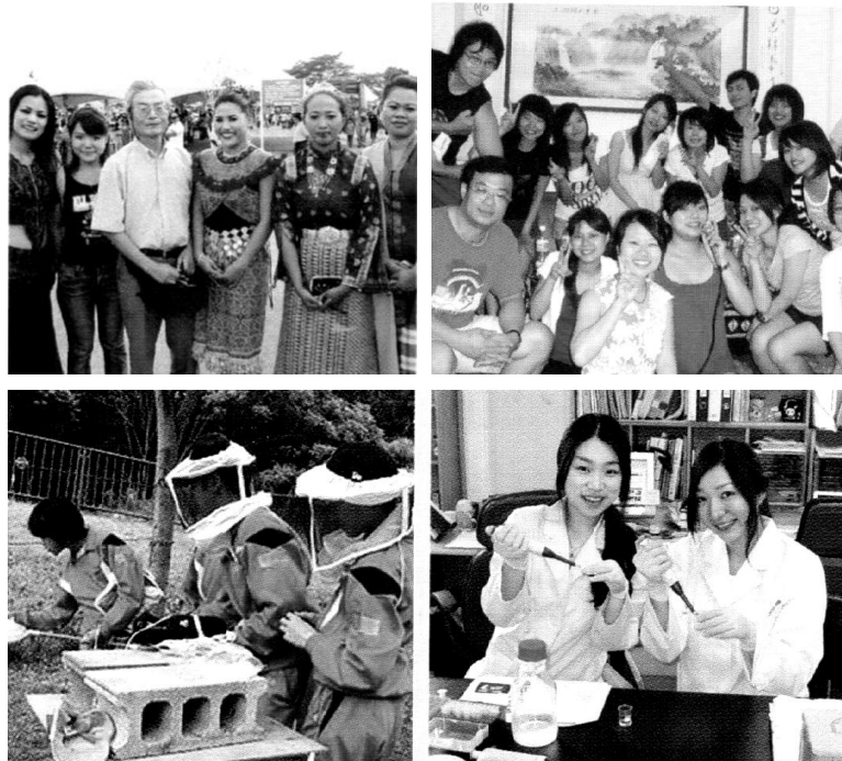
図2 インターンシップの活動記録。マレーシア(左上)、台湾(右上)、兵庫県(人と自然の博物館)(左下)、韓国(右下)におけるインターンシップ期間中のひとこま。

研究室での技術習得や社会学的なフィールドワークの訓練などを目的に実施された。国内でのインターンシップは、4か月程度にわたって週1～2回大学や博物館などの研究機関に通い、技術習得や学校における指導アシスタントを行った(図2)。