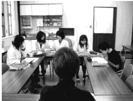
図4 サイエンスのための語学研修の実施中の様子。

ス・コミュニケーションに関するレクチャーをしてもらったり、それぞれの専門分野における先端的トピックスや女性研究者のロールモデルとして自分の研究史を紹介してもらったりした(図5)。ほぼ月に1回のペースで、平成19年度は6回、20年度は12回、21年度は12回、計30回開催した。内訳として人間行動学分野は7回、環境科学分野は14回、健康科学分野は9回だった(表4)。