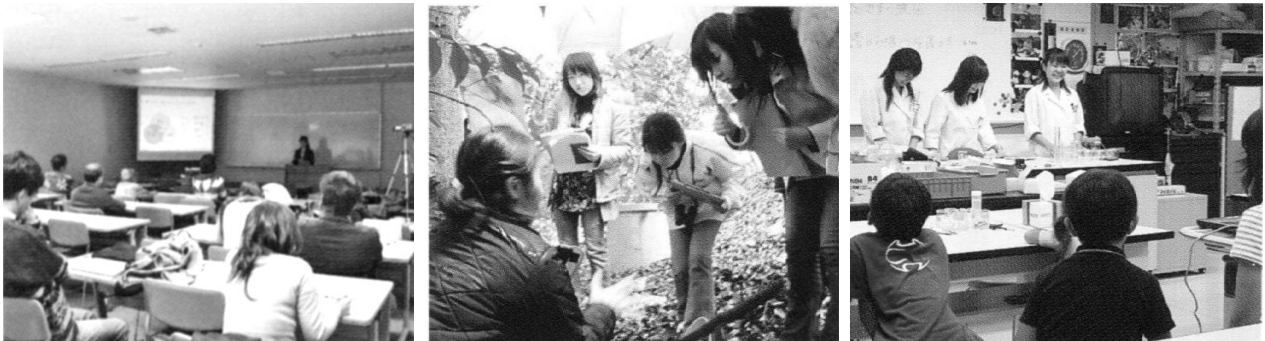
図3 サイエンス・アウトリーチの活動記録。修士研究発表会（左）、サイエンス体験（中央）、伊丹市親子理科教室（右）のときの様子。

サイエンス教室等は、本学人間科学部環境・バイオサイエンス学科が主催している小学生や高校生を対象とした「こどもサイエンス体験教室」、「サイエンス体験」の中で大学院生によるコーナーを設け、各自の研究紹介や科学的な関心を引き出すようなプレゼンテーションをしてもらった（図3中央）。また、外部から依頼された場合には、出張模擬実験教室のようなかたちで「理科教室」を行った（図3右）。それらの内容については、大学院生自身が企画発案した。