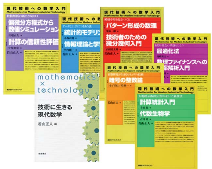
図 2 産業技術数理教科書

MI レクチャーノートシリーズを、グローバル COE プログラムと共同出版した。講義ノート以外にも、産業技術数理研究センターやグローバル COE 拠点が主催/共催する国際研究集会やチュートリアル of 論文集や要旨集を収録して、産業技術数理研究の最前線を紹介し情報提供にも努めた。また、数理学研究院教員が中心となって産業技術数理に関する教科書を執筆し、岩波書店、講談社、日本評論社から出版した。これらを、九州大学大学院共通講義「機能数理学概論」や MMA コース向けの「数理モデル概論」などのオムニバス講義の教科書、あるいは、執筆者の大学院講義の教科書として使用し、多様な背景をもつ学生たちが広い分野にまたがる講義内容を理解するための助けとして役立てた。