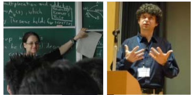
写真 2 英語講義

また、学生の原著論文の英文校正費用を援助することで、国際学術雑誌への投稿を促進した。さらに、大学院学生の国際会議参加費用を援助して成果発表を促進し、海外でも通用する研究能力の涵養育成をはかった。