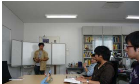
写真1 MMA 講究

学位：修士(技術数理学)、2年以上在学し、30単位以上を修得し、かつ、必要な研究指導を受けた上、本学府教授会の行う講究報告の審査及び最終試験に合格すること。