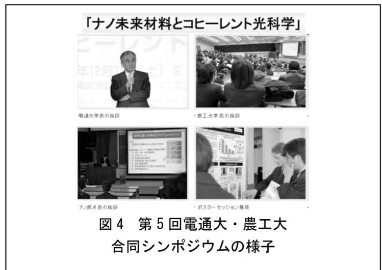
図 4 第 5 回電通大・農工大 合同シンポジウムの様子

申請書等を厳正に審査し、8 名の D0 と 30 名の RA を選抜した。上記に記載した事業を精力的に推進し、社会で即戦力となる多数の博士号取得者を輩出する事ができた。本教育プログラムを修了した博士号取得者はその半数程度が企業に就職しており、本教育プログラムが目的とした「産業界の即戦力