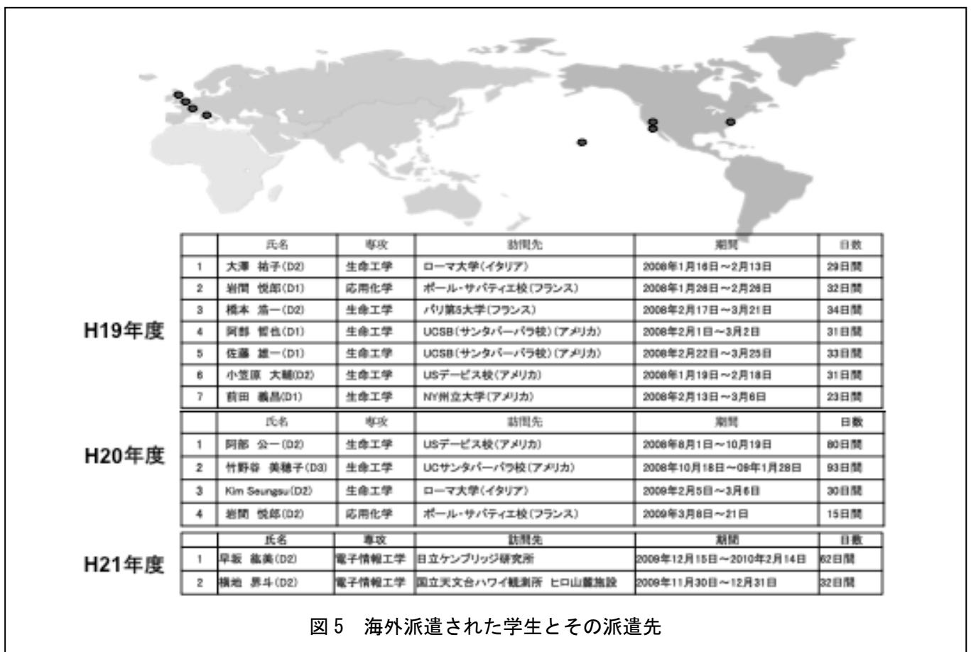
図5 海外派遣された学生とその派遣先

また、同じく本教育プログラムの特長である海外派遣については、図5に示す通り、平成19年度には7人、平成20年度には4人、平成21年度には2人の博士後期課程学生が、世界6カ国の著名な大学の様々な分野の最先端研究を主導する研究室で海外研修を行っている。それぞれの博士後期課程学生が、現在東京農工大学で遂行している研究と異なるテーマでの研究を遂行し、学術論文に投稿できる内容の研究成果を上げた学生もいた。平成19年度は年度途中から本プログラムが開始されたので、それぞれ1ヶ月程度の研修しかできなかったが、平成20年度以降は3ヶ月近く海外の研究室に滞在し、十分な研究成果を上げること成功している。勿論このような長期滞在の場合は、派遣側、受け入れ側双方の研究室で学生の派遣前に綿密な研究打ち合わせを行っている。また、その打ち合わせの段階から学生は英文メールにより派遣先の指導教官とやり取りを行っている。