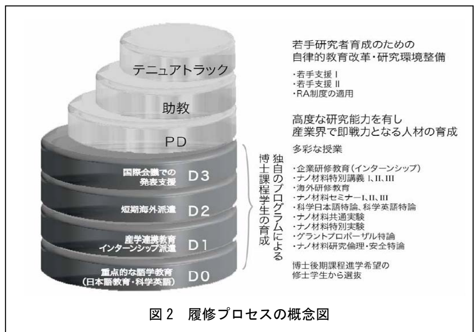
図 2 履修プロセスの概念図