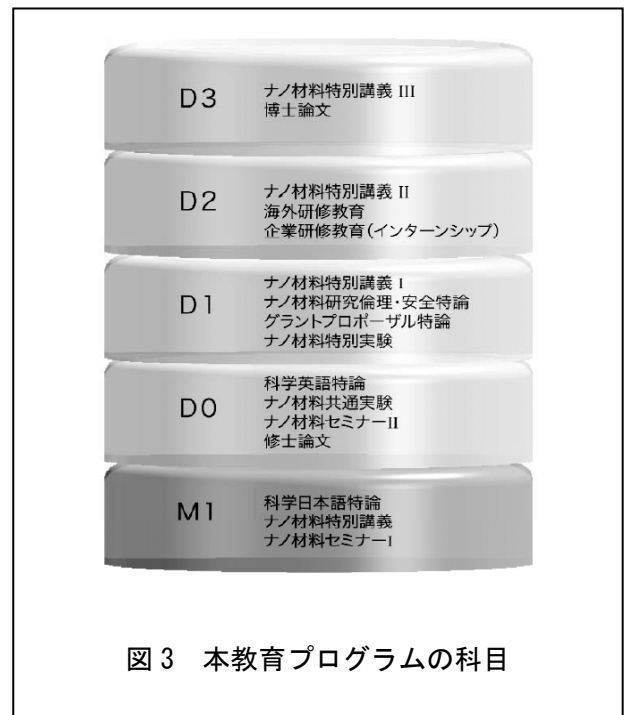
図3 本教育プログラムの科目

全ての科目の成績をパソコンから入力するシステムを完成させた。これにより、成績の分布など、各講義の成績の分析を瞬時に行うことが可能になった。