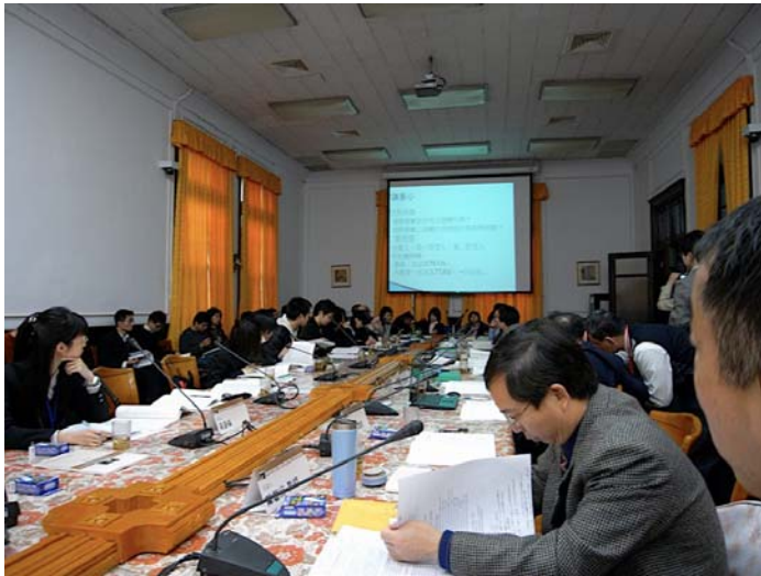
写真 5 国立台湾大学・ 北海道大学 法学研究科 共同セミナー