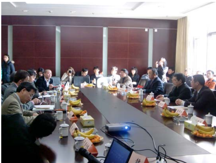
写真 6 上海・南京 訪問セミナー