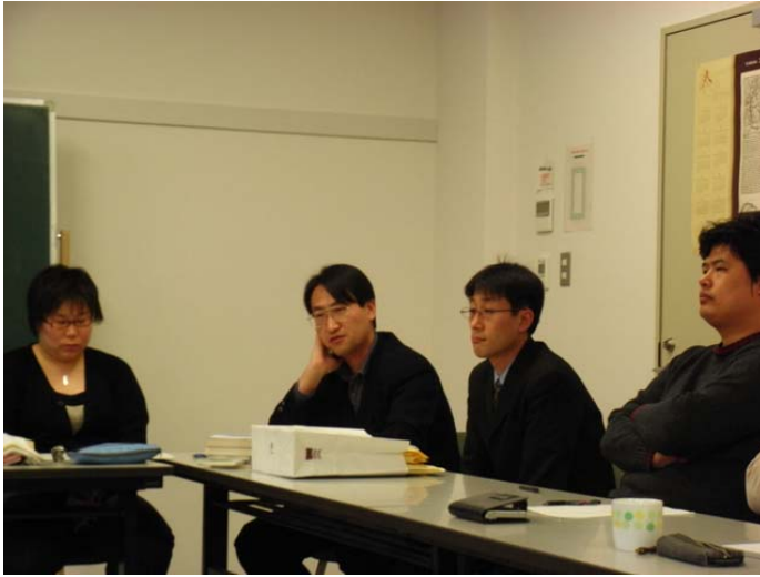
写真7 助教による 博論執筆講座