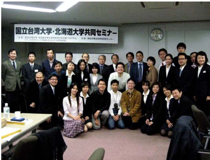
写真4 北海道大学・ 国立台湾大学 共同セミナー