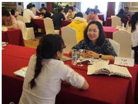
ACBI 2017 Ho Chi Minh Meeting Interview Session の様子