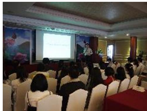
ACBI 2017 Ho Chi Minh Meeting Tutorial Session の様子