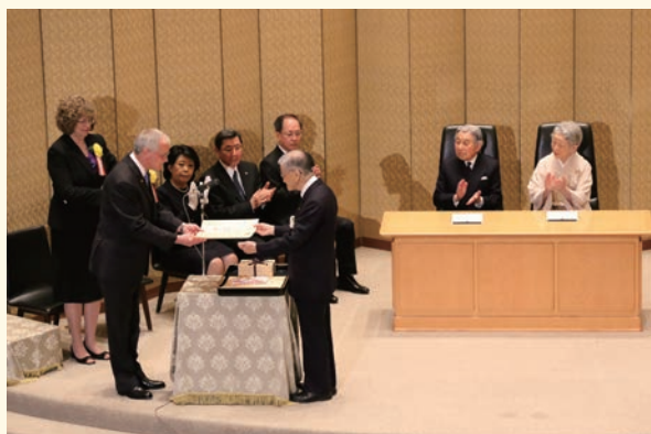
第30回授賞式(受賞者:ピーター・クレイン博士)