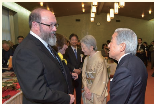
ジョセフ・フェルゼンシュタイン博士(第29回受賞者)と 両陛下(記念茶会にて)