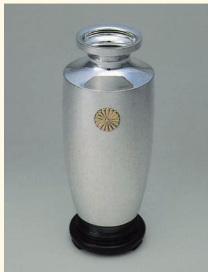
国際生物学賞の受賞者に贈られる 天皇陛下からの賜品「御紋付銀花瓶」