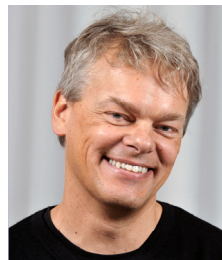
エドバルド・I・モーセル (2014,生理学・医学賞)