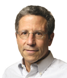
エリック・S・マスキン (2007,経済学賞)