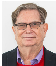
ジョージ・F・スムート (2006,物理学賞)