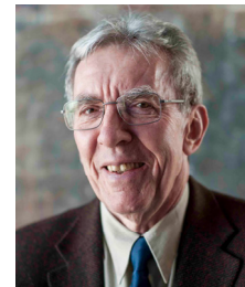
ジャン＝ピエール・ソバージュ (2016,化学賞)