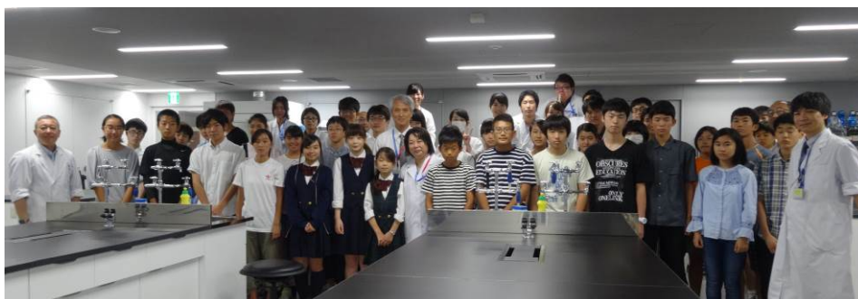
『修了証書授与式』の様子と終了後の記念撮影