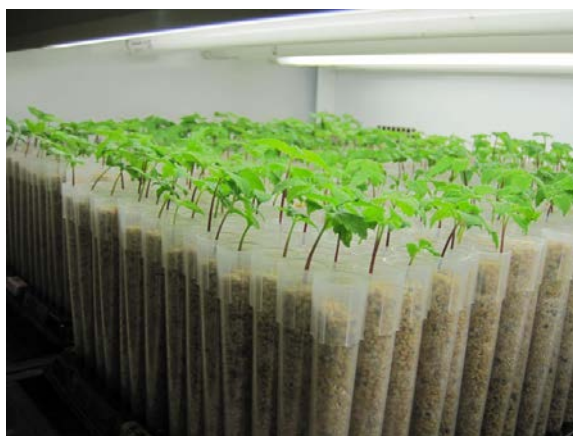
植物工場内で試験栽培されているオタネニンジン