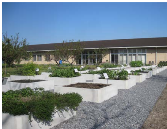
柏の葉診療所 東洋医学センター(後方)と薬草園

先人たちが植物の力を巧みに利用してきた東洋医学を学ぶ機会になるだけでなく、医学、薬学、鍼灸学、園芸学を専門とする各先生が集まり、植物を中心に捉えた新たな学問横断型の研究に触れる良い機会にもなるでしょう。