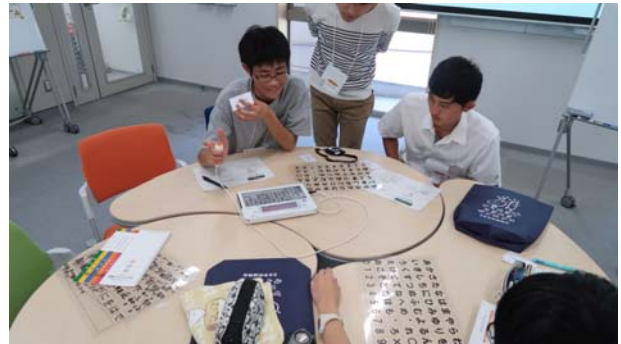
コミュニケーション支援機器の体験(左:電気式人工喉頭、右:レッツ・チャット)