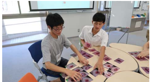
左:コミュニケーション支援機器の体験(コミュニケーション絵本)、右:口形カードによるパズル