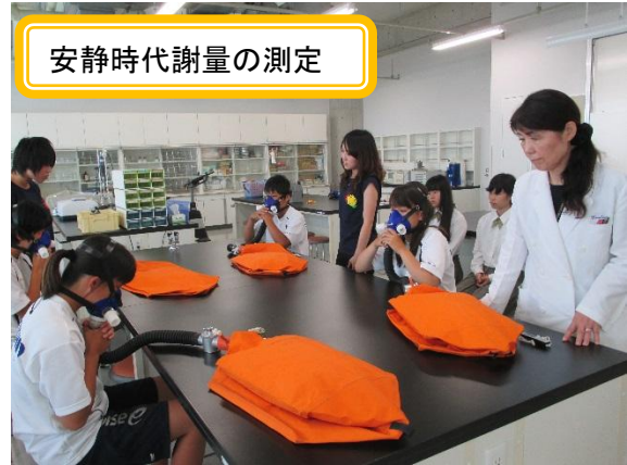
安静時代謝量の測定