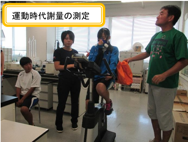
運動時代謝量の測定