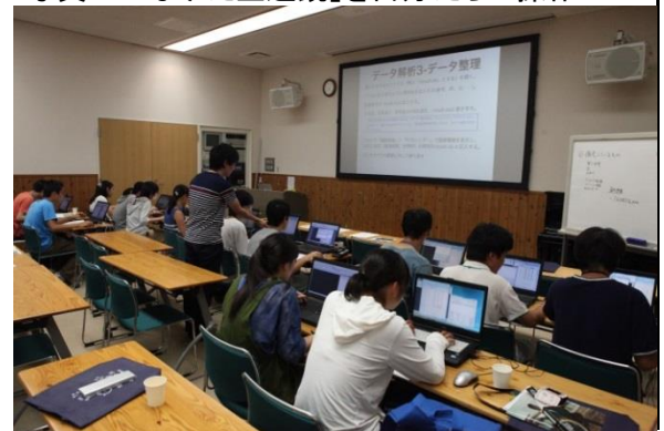
写真3: 取得したデータの解析