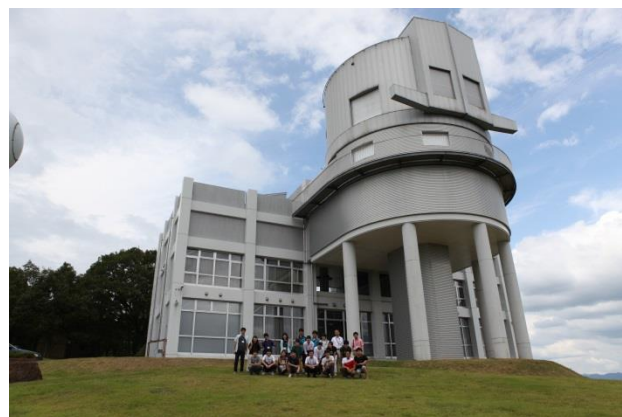
写真 6: 「なゆた望遠鏡」の前で記念撮影