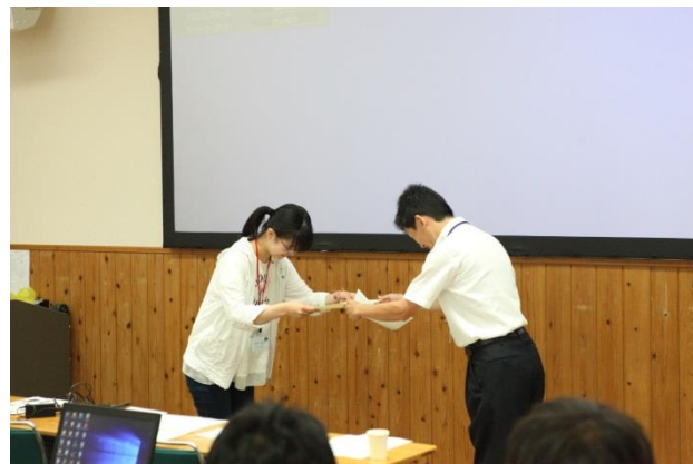
写真 5: 未来博士号の授与