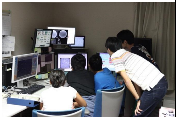
写真2: 「なゆた望遠鏡」を自分たちで操作