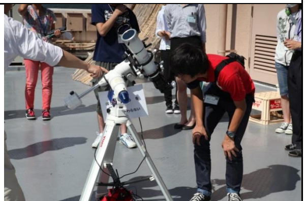
写真1: 専用望遠鏡で太陽を観察