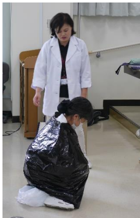
ビニール袋を使用した方法

災害用のトイレの使用法の説明を行った。非常用のトイレの使い方、非常時にトイレがない時にビニール袋を活用したトイレの作成方法などであった。その後、グループ(1グループ4名程度)に分かれ、実際のトイレで、非常用トイレを設置し、排尿の代わりにペットボトルに入れた色水500mlを流すことでどのようなか体験した。1グループに1名にファシリテーターとして学生を配置した。