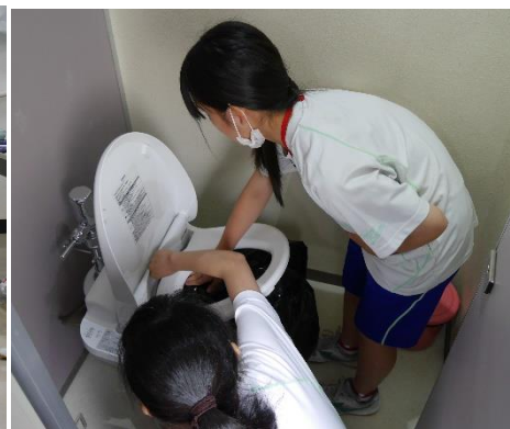
実際のトイレで非常時のトイレ体験