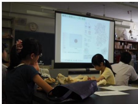
講義①「動物のからだのしくみを知ろう」