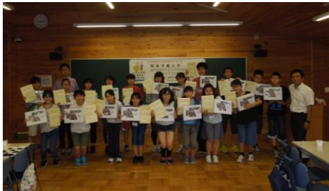
修了式後 集合写真