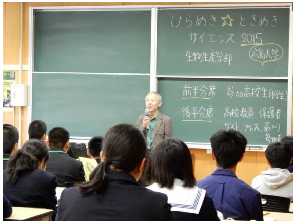
(生物生産学部学部長・植松先生の挨拶)