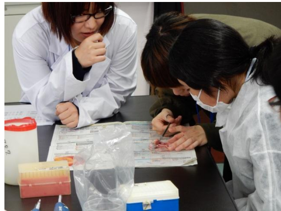
(PCR 準備のためのピペット操作とニワトリ胚の解剖実験)

PCR 増幅の待ち時間は、楽しみのお弁当タイムです。「ひらめき☆ときめきサイエンス高校生スペシャル」と銘打たれた生物生産学部とお弁当屋さんのコラボ弁当を皆で食べながら話に花が咲きます。本日の講座のこと、生物生産学部のこと、大学生生活のことなどを話題に和気藹々の時間があっという間に過ぎ、午後は西堀の講演の始まりです。