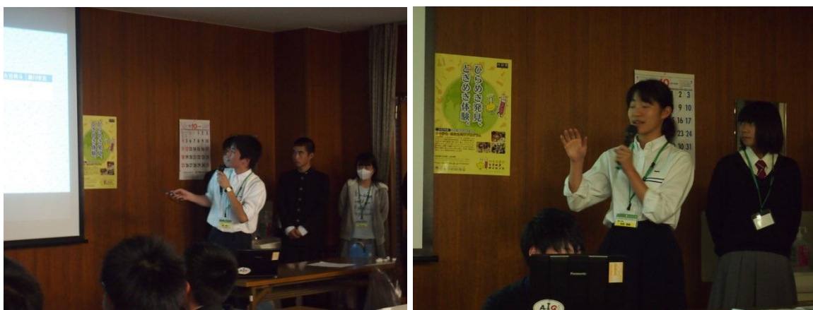
(グループごとの結果発表プレゼン：堂々と発表しました)

一方，TA，とくに SA の学生は「教える」ことの難しさを体感したようです。そして他人に教えることで自分たちが何を知らなかったのかを改めて認識することができたとアンケートにも書いてくれました。