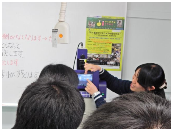
(熱心な説明をする TA)