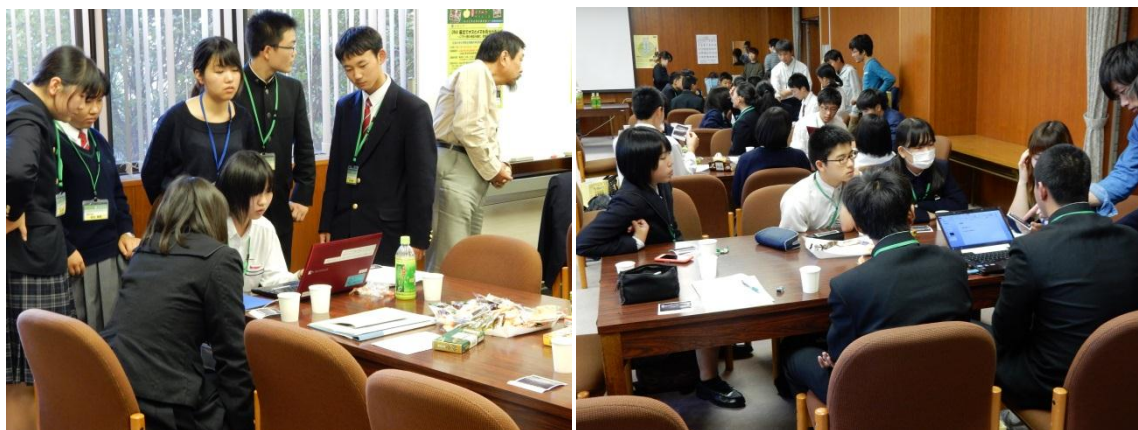
(プレゼン準備：パワーポイントファイルも自分たちで作成)

お菓子のもたらず効果でさらに場は盛り上がり，そのままグループディスカッションに突入。結果をグループごとに Power Point でプレゼンテーションしながら，会場全員で考察・討論し，中には実験の感想や来年への要望などの意見も飛び出しました。うまく結果が得られたグループもあれば，きれいに判定できなかったグループもありました。サイエンスには成功も失敗もあること，そして結果を如何に議論し，次に繋げる何かを見出すことがサイエンスのおもしろさであることも実感できました。