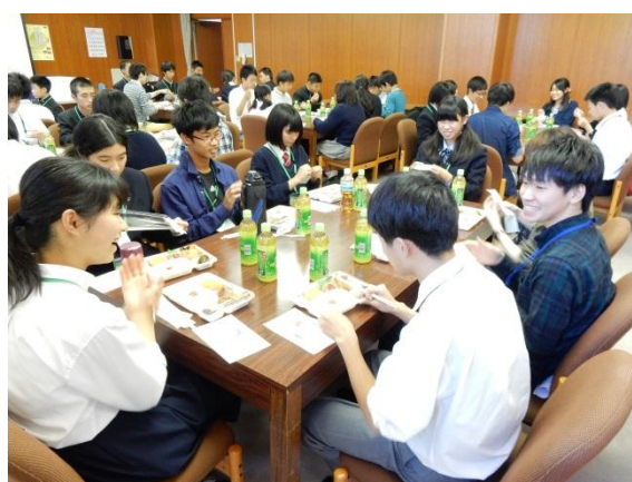
(お弁当タイム：本年も特製にしぼり・ひらめき☆ときめきサイエンスコラボ弁当)