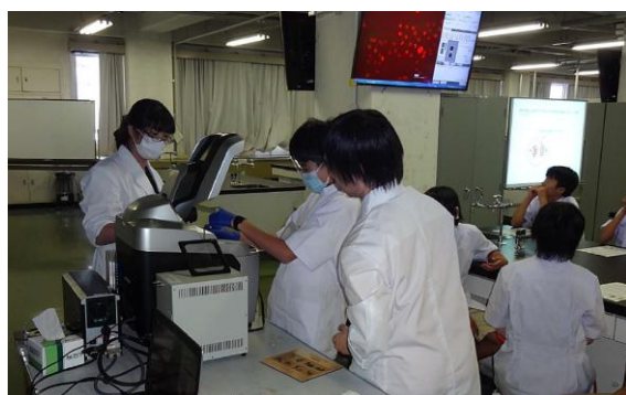
顕微鏡で細胞分裂を観察