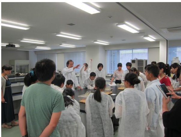
がん細胞移植ヌードマウス