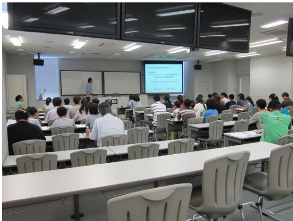
“がんとは何か？”の講義