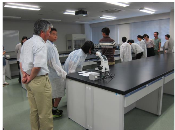
がん細胞の顕微鏡観察