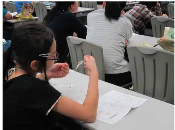
ビーズを用いたDNA模型作り