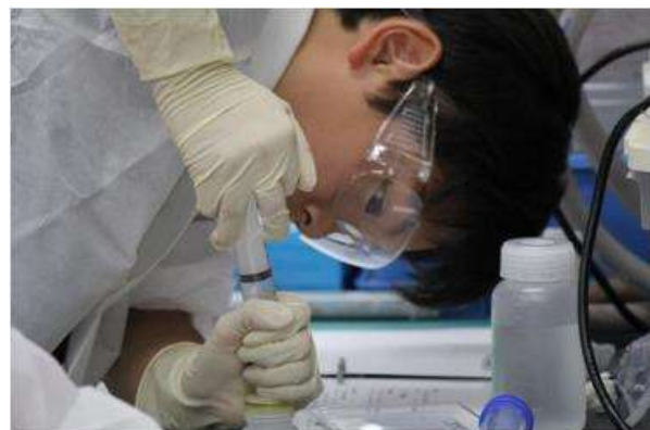
天然ゼオライトに接触させたアンモニア溶液をろ過している様子(実習2)