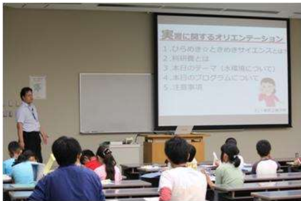
オリエンテーションの様子