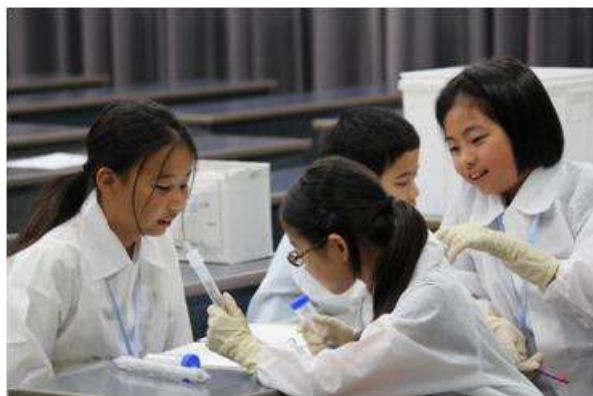
カラム管中に天然ゼオライトを入れ、水浄化装置を作製している様子(実習1)