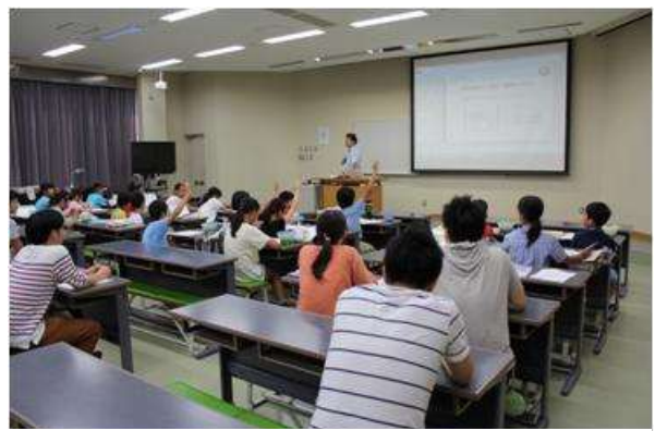
本プログラムのまとめをしている様子