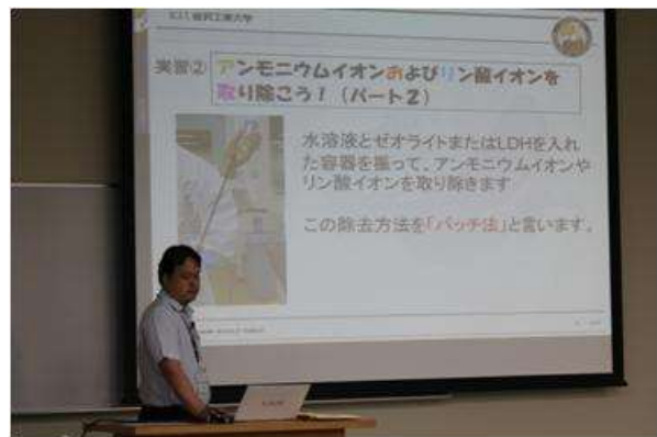
ゼオライトを用いた水浄化の説明の様子(講義1)