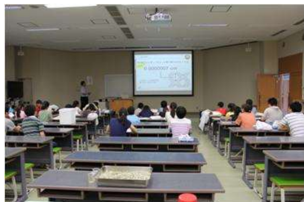
ゼオライトの構造と肥料について説明している様子(講義2)