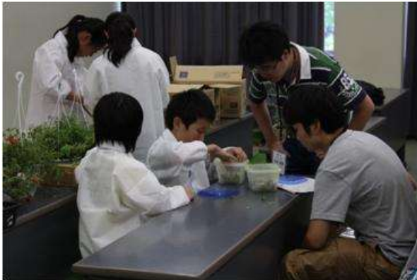
ゼオライトを使った水耕栽培装置を作製している様子(実習5)