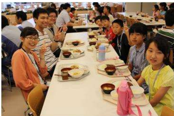
学生食堂にて実施代表者と実施協力者と一緒に食事をしている様子