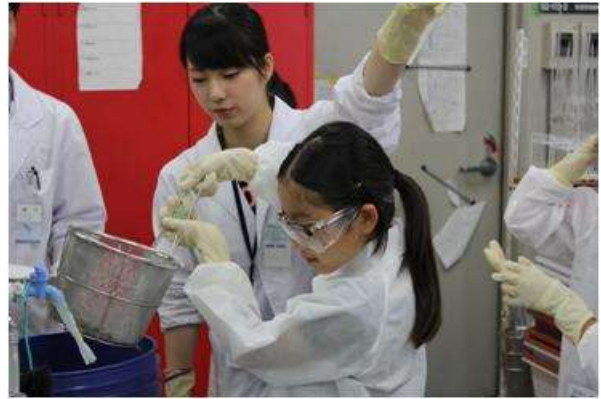
使用済ゼオライトから植物肥料を合成している様子(実習4)