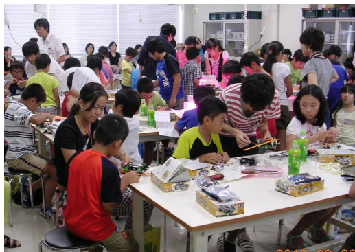
ソーラーカー製作の様子