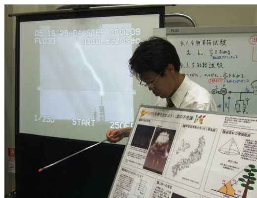
高電圧(雷)実験の説明の様子