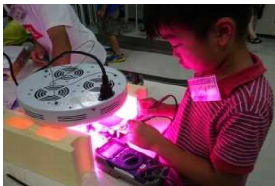
ソーラーカーの充電の様子