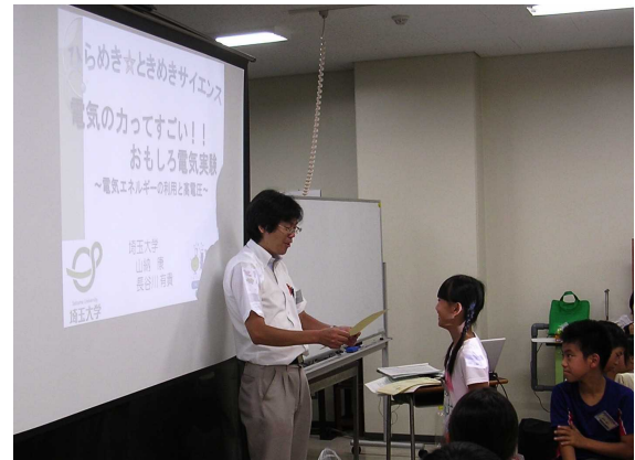
未来博士号授与式