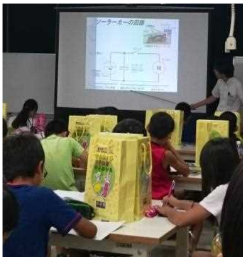
開講式とオリエンテーション