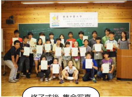
修了式後 集合写真