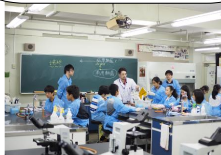
実験①「悪い細菌を見つけ出そう！」