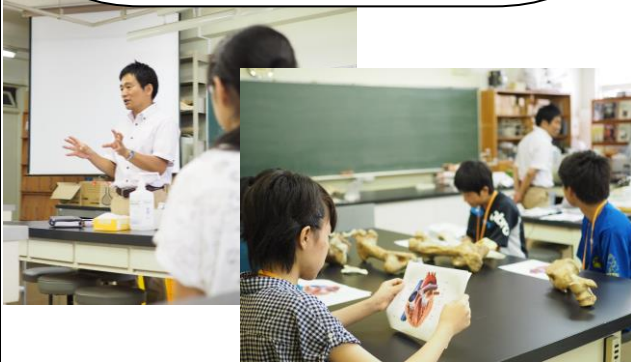
講義①「動物のからだのしくみを知ろう」