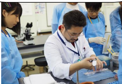
実験②「バクテリオファージの実験」