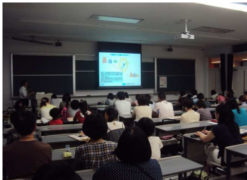
実験1-2「葛根湯」に含まれている 草木からくすりをみつけよう！