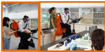
運動時のエネルギー代謝量測定