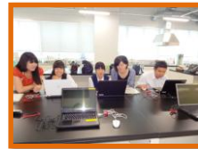
パソコンによる食事診断