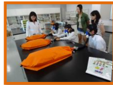
安静時代謝量の測定