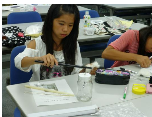
(実習②「箔検電器づくり」)