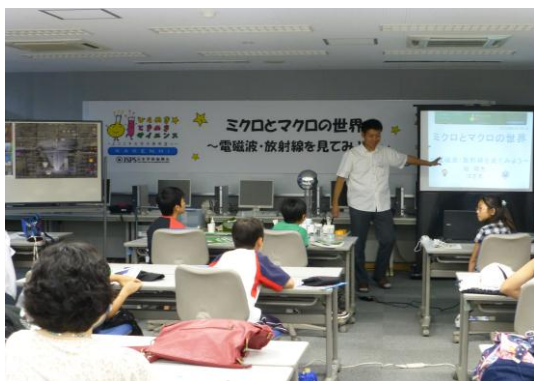
(講義「マイクロとマクロの世界」)

・またスケールを実感出来るよう地球を100cmの大きさとして太陽系の各天体までの距離を地元の場合になぞらえ説明を行った。併せて、身近な天体である太陽、月及びそれらの地球環境への影響を例示し、地球外生命探査・極限環境生物の一例として本学で採取した「クマムシ」の映像も供し、かけがえのない地球及び人類誕生・生存のより深い真理にも触れるよう留意した。これらは普段、学校で行っている答えの分かっている勉強とは異なり自分で問題を見つけ、とことん納得するまでいろんな角度から考え、答えが分からないまたひとつでない課題・取組・面白さに触れる機会になったと期待する。