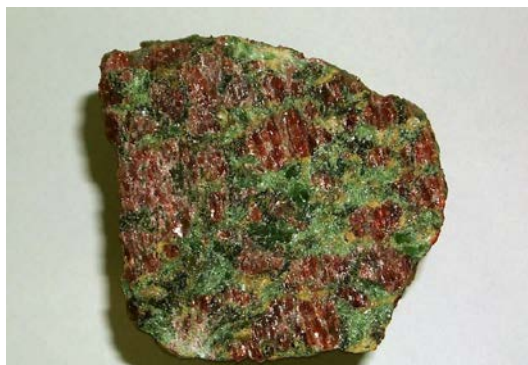
ノルウエーの西海岸地方に分布するエクロジヤイトという変成岩。赤い宝石質のざくろ石(ガーネット)と緑の輝石からなる美しい岩石。

ます。このような地表付近では見ることのできないめずらしい岩石や鉱物を観察することを通して、地球の内部の構成や構造について理解していただきます。また、島根大学の研究者が開発したペットボトル偏光顕微鏡を受講者自身に自作していただき、この顕微鏡を使って変成岩を観察します。あわせて、偏光顕微鏡に使われている偏光(板)の原理を理解するため、偏光板マジックのアトラクションを行います。観察に使用した変成岩サンプル及び受講者が作成した偏光顕微鏡は持ち帰りいただき、受講後の観察に使っていただきます。さらに、今回もめずらしい変成岩や美しい変成鉱物の標本のおみやげもありますので、お楽しみに。なお、受講者には「未来博士号」が授与されます。